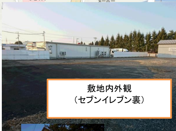
敷地内外観 (セブンイレブン裏)